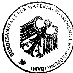
Dipl.- Ing. B.-U. Wienecke

Arbeitsgruppe Zulassung und Verwendung Im Auftrag / For